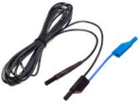
Przewód 5 m czarny 1 kV (wtyki bana- nowe, ekranowany)