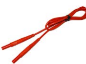
Przewód 1,2 m czerwony 1 kV (wtyki bananowe)